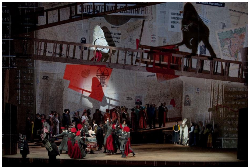
Рис. 1. Опера Д. Шостаковича «Нос» в постановке реж. У. Кентриджа на сцене «Метрополитен-опера». 2010.