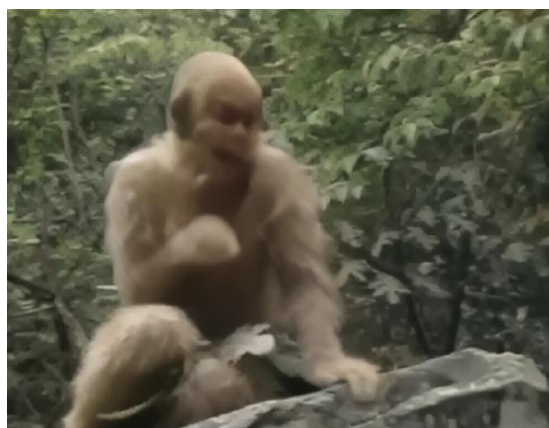
Рис. 3. Сунь Укун в телевизионном сериале «Путешествие на Запад», 1986 г.

В Китае классической, то есть максимально приближенной к тексту романа У Чэньэня, считается телевизионный сериал «Путешествие на Запад» 1986 г. (реж. Я. Цзе, С. Хао, Р. Фенгпо). Это одна из первых кинематографических адаптаций романа: к 1980м годам в кинематографе появились первые технологии, позволяющие воплощать на экране фантастические сюжеты, которые ранее могли быть только нарисованы в анимационном варианте. Поскольку главный герой полуобезьяна-получеловек, то визуальное решение облика Сунь Укуна сделано типично для кинематографа 1980-х годов – это переодетый в костюм актёр (рис. 3), подобным образом решены и иные полу животные-полулюди (монах-свинья Бацзы, демоны и др.) Также в сериале используется примитивная графика с наложением анимационных вставок на кинематографическую съемку или трюковые элементы (анимирование персонажей на фоне экрана) в тех случаях, когда невозможно вживую заснять фантастические перемещения Сунь Укуна и иные невозможные в реальности ситуации.