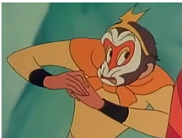
Рис. 2. Сунь Укун в анимационном фильме «Путешествие на Запад», 1965 г.

В Китае классической, то есть максимально приближенной к тексту романа У Чэньэня, считается телевизионный сериал «Путешествие на Запад» 1986 г. (реж. Я. Цзе, С. Хао, Р. Фенгпо). Это одна из первых кинематографических адаптаций романа: к 1980м годам в кинематографе появились первые технологии, позволяющие воплощать на экране фантастические сюжеты, которые ранее могли быть только нарисованы в анимационном варианте. Поскольку главный герой полуобезьяна-получеловек, то визуальное решение облика Сунь Укуна сделано типично для кинематографа 1980-х годов – это переодетый в костюм актёр (рис. 3), подобным образом решены и иные полу животные-полулюди (монах-свинья Бацзы, демоны и др.) Также в сериале используется примитивная графика с наложением анимационных вставок на кинематографическую съемку или трюковые элементы (анимирование персонажей на фоне экрана) в тех случаях, когда невозможно вживую заснять фантастические перемещения Сунь Укуна и иные невозможные в реальности ситуации.