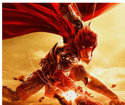
Рис. 6. Сунь Укун в мультфильме «Король Обезьян: возвращение героя», 2015 г.: до и после преобразования.