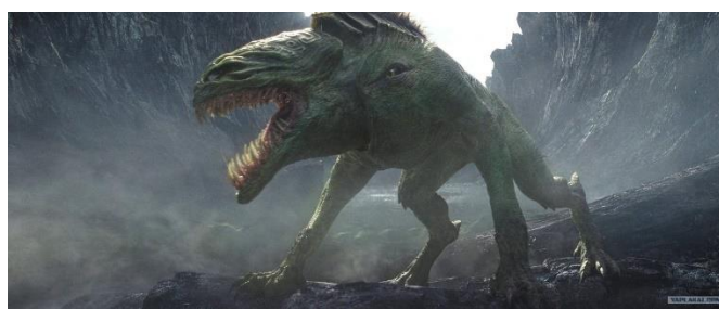
Рис. 7. Демоны в мультфильме «Король обезьян: возвращение героя» и фильме «Великая стена»