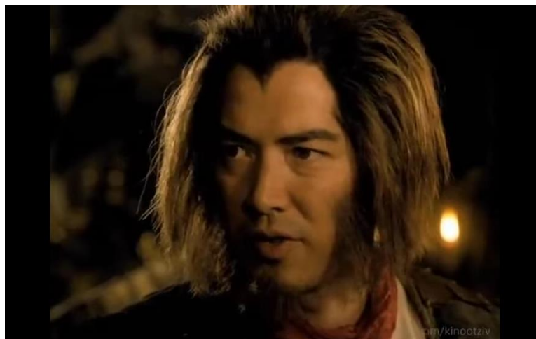
Рис. 5. Сунь Укун в мини-сериале NBC «Путешествие на Запад», 2001 г.

образом, данный мини-сериал является шагом в сторону объединения западных и восточных культурных ценностей.