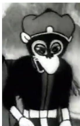
Рис. 1. Сунь Укун в анимационном фильме «Принцесса – железный веер», 1941 г.

Стоит обратить внимание на то, что первый китайский анимационный фильм был создан как раз на основе легенды о Сунь Укуне в 1941 г. Мультфильм «Принцесса – железный веер» был спродюсирован компанией «Warner brothers», акцентировал внимание на проблемах японско-китайских отношений. Сам визуальный образ Сунь Укуна был вдохновлен Микки-Маусом или образом Папайи, то есть полностью соответствовал американскому визуальному стилю (рис. 1).