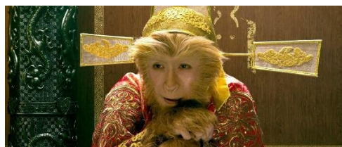
Рис. 4. Сунь Укун в фильме «Царь обезьян: хаос в небесном дворце», 2014 г.

Классическая версия изображения Сунь Укуна в телевизионном сериале 1986 г. стала основной для последующей работы с образом Короля Обезьян в китайском кинематографе. Так пластика, крики, ужимки костюмированного Сунь Укуна были полностью сохранены в более современной версии этого персонажа, созданного в фильме «Царь обезьян: хаос в небесном дворце» 2014 г. (реж. Сои Чанг, производство – Гонконг) (рис. 4). Фильм воспроизводит первую часть истории Сунь Укуна – его борьбу с Нефритовым Императором, разрушением Небесного дворца, история остается приближенной к тексту романа, важным отличием от телевизионной версии романа 1986 г. является технологически более совершенное воплощение фантастической составляющей истории, здесь использовались новые возможности современной компьютерной графики. В создании фильма принимали участие голливудские специалисты по визуальным эффектам, поэтому драки и полеты на облаках напоминают американские супергеройские фильмы. Однако критики отмечают, что качество компьютерной графики не столь высоко как в американских оригиналах.