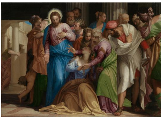
Рис. 1. Паоло Веронезе «Обращение Марии Магдалины»

Изобразительное искусство переводит духовные понятия в визуальные. Анализируя историю искусства [19, 21, 44], мы становимся свидетелями онтологизации разных аспектов духовного понятия «Мария Магдалина». Произведения изобразительного искусства раскрывают разные аспекты проявления сущности святой в визуальных текстах [3, 15, 47], и так способствуют становлению многогранного визуального понятия «Мария Магдалина».