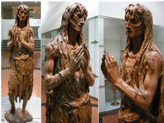
Рис. 10. Донателло (Донато ди Никколо ди Бетто Барди) «Мария Магдалина» 1450-е гг. Дерево, 188 см. Музей Собора Дуомо, Флоренция

Скульптура «Мария Магдалина» (Рис. 10) была создана Донато ди Никколо ди Бетто Барди из дерева в 1450-е годы.