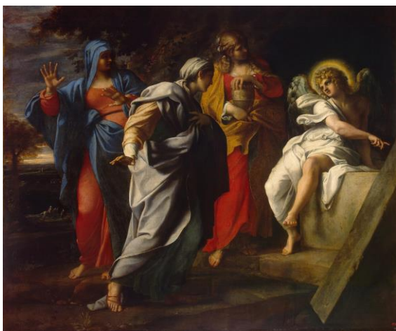
Рис. 6. Аннибале Карраччи. «Жены-мироносицы у гроба Господня»

текстах так: «По прошествии же субботы, на рассвете первого дня недели, пришла Мария Магдалина и другая Мария посмотреть гроб» (Мф. 28:1); «По прошествии субботы Мария Магдалина и Мария Иаковлева и Саломия купили ароматы, чтобы идти помазать Его. И весьма рано, в первый день недели, приходят к гробу, при восходе солнца. И говорят между собою: кто отвалит нам камень от двери гроба? И, взглянув, видят, что камень отвален; а он был весьма велик. И, войдя в гроб, увидели юношу, сидящего на правой стороне, облеченного в белую одежду; и ужаснулись. Он же говорит им: не ужасайтесь. Иисуса ищите Назарянина, распятого; Он воскрес, Его нет здесь. Вот место, где Он был положен» (Мк.16:1-6). Священные тексты говорят, что в то время, когда Мария Магдалина держит в руках сосуд с миро для ритуального умащения тела погребенного, ангел, отверзший гробницу, говорит ей о том, что могила пуста и что все законы тленности плоти преодолены Христом.