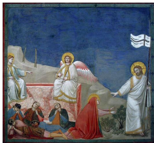
Рис. 7. Джотто ди Бондоне «Noli me tangere»

ей дотронуться до Него, но завещал возвестить апостолам о Своем Воскресении. «А Мария стояла у гроба и плакала. И, когда плакала, наклонилась в гроб, И видит двух Ангелов, в белом одеянии сидящих, одного у главы и другого у ног, где лежало тело Иисуса. И они говорят ей: жена! что ты плачешь? Говорит им: унесли Господа моего, и не знаю, где положили Его. Сказав сие, обратилась назад и увидела Иисуса стоящего; но не узнала, что это Иисус. Иисус говорит ей: жена! что ты плачешь? кого ищешь? Она, думая, что это садовник, говорит Ему: господин! если ты вынес Его, скажи мне, где ты положил Его, и я возьму Его. Иисус говорит ей: Мария! Она, обратившись, говорит Ему: Раввунни! – что значит: «Учитель!». Иисус говорит ей: не прикасайся ко Мне, ибо Я еще не восшел к Отцу Моему; а иди к братьям Моим и скажи им: «восхожу к Отцу Моему и Отцу вашему, и к Богу Моему и Богу вашему». Мария Магдалина идет и возвещает ученикам, что видела Господа и что Он это сказал ей» (Ин. 20:11-18). Сущность Марии как избранной свидетельницы Воскресения раскрывают произведения разных художников на сюжет «Noli me tangere» («Не прикасайся ко мне»). Среди них – мастер Предвозрождения Джотто ди Бондоне (Рис. 7), русский художник Александр Иванов (Рис. 8), а также Тициан Вечеллио и другие живописцы [4].