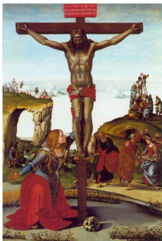
Рис. 2. Лука Синьорелли «Мария Магдалина у Распятия»

Рогир ван дер Вейден воплощает в Магдалине аспект сострадания. В Евангелии от Матфея сказано: «И, взяв тело, Иосиф обвил его чистою плащаницею И положил его в новом своем гробе, который высек он в скале; и, привалив большой камень к двери гроба, удалился. Была же там Мария Магдалина и другая Мария, которые сидели против гроба» (Мф. 27:59-61). В произведении «Снятие с креста» (Рис. 4) Мария изображена необходимым участником событий Пьеты. Взгляд Магдалины устремлен на пробитую стопу ноги тела Христова, и она представлена ломающей свои руки в глубоком порыве сострадания (Рис. 5).