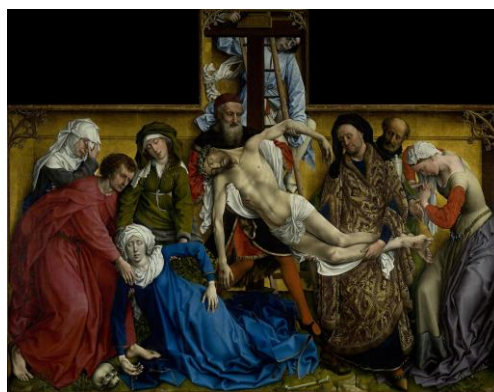
Рис. 4. Рогир ван дер Вейден «Снятие с креста»