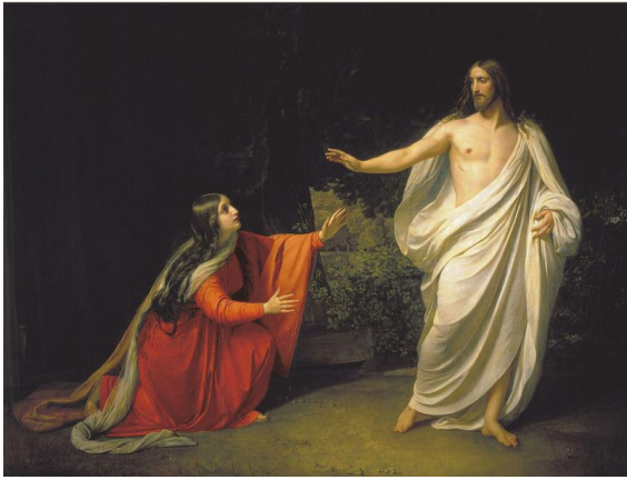
Рис. 8. Александр Иванов «Не прикасайся ко мне»

Таким образом, произведения живописи становятся визуальными свидетельствами Благовестия о том, как Мария Магдалина была исцелена Христом, служила Ему на земле, стояла у креста Распятия, присутствовала при погребении, первой засвидетельствовала событие Воскресения и лично из уст Христа получила завет распространять весть о вознесении среди Его учеников и всех верующих.