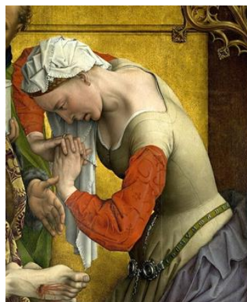
Рис. 5. Мария Магдалина. Фрагмент

Аннибале Карраччи в произведении «Жены-мироносицы у гроба Господня» (Рис. 6), написанном в 1590 году, демонстрирует сущность Марии как мироносицы, первой получающей весть о Воскресении Христа. Это событие зафиксировано в нескольких евангельских