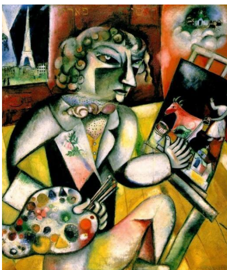
Рис. 2 Марк Шагал. Автопортрет с семью пальцами.

В этой картине, также, как и в предыдущей, он смешивает в единое целое и актуальный биографический факт, и новые течения французской живописи, и иконописные традиции. Но здесь возникает и его этнокультурный фон – происхождение из Витебска, из «стены» проявляются еврейские надписи в верхней части работы [6].