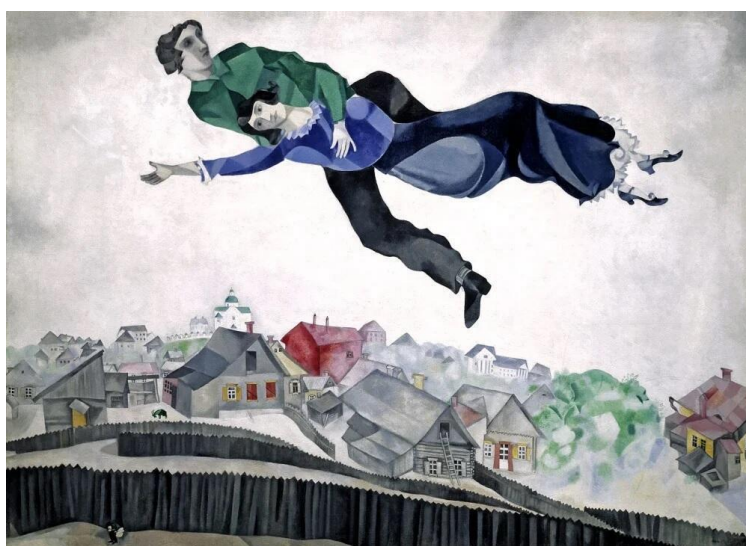
Рис.3 Марк Шагал. Над городом.

Обратим внимание на семь ключей к этой работе.