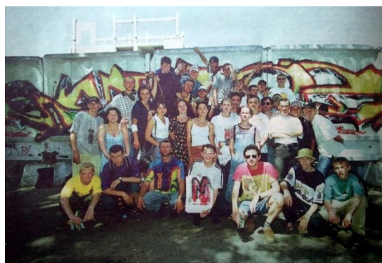
Первая акция граффити в Барнауле «Вымоем стены краской!». 2000

В мероприятии «Слово на заборе — тоже искусство!» приняли участие восемь команд, каждая из которых внесла свой оригинальный художественный подход и концептуальное видение в процесс создания граффити. Основными участниками акции были профессиональные-художники, а также группы ребят, которые ранее уже занимались уличным искусством.