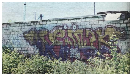
Граффити Димы Goa.

Фотография граффити Димы Goa в цвете опубликовала газета «Свободный курс» в конце июня 2000 года [7]. Это надпись в стиле bombing, трудночитаемый текст по краям оканчивающийся руками, в центре над буквами два глаза на два нижних штриха одеты трусы в горошек.