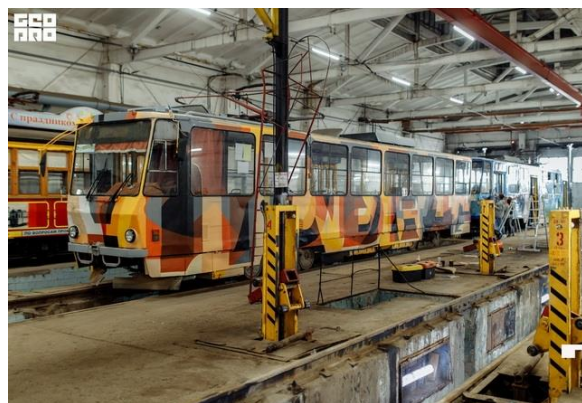
Трамвай, расписанный в абстрактной стилистике художником Евгением Алехиным в рамках фестиваля стрит-арта «Tok Fest». 2020. Барнаул

получила знания и навыки организации городских фестивалей уличного искусства. После возвращения в родной город инициативу поддержал Краевой дворец молодёжи, предложивший ей возглавить проект проведения первого в Барнауле фестиваля «Tok Fest», посвященного 75-летию Победы. Особенностью этого фестиваля стало тематическое оформление пяти городских трамваев, которые стали уникальными движущимися арт-объектами, усиливая визуальную идентичность и культурный имидж города.