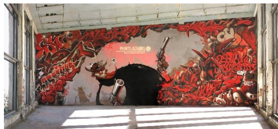
Фестиваль «Paint Methods 2: Hardcore». 2007. Барнаул