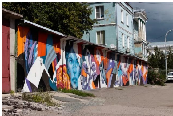
Роспись гаражей в рамках фестиваля «Ближе». 2020. Барнаул

Арт-форум, организованный командой «О2 Team» и охвативший не только Барнаул, но и соседние города — Заринск, Бийск и Рубцовск, отметил значительный этап в региональном развитии стрит-арта, способствуя